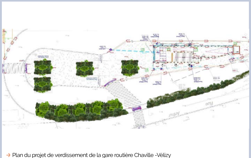
→ Plan du projet de verdissement de la gare routière Chaville -Vélizy

Travaux de création d'espaces verts dans la sente du vieux pont de Bois, future placette Jeanne Jaeger (à partir de novembre)